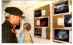
शाली न्यायमूर्ति विजयलक्ष्मी, निवेदित शारिता से खत्म होना धर्म आधारित विरगति का